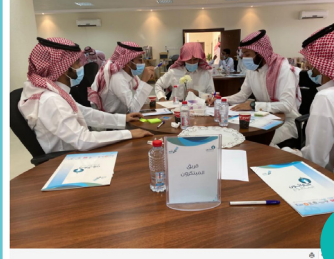
كارثون التطوع باكورة جمعية همم شبابية