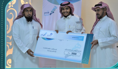
فريق فتيات محافظة الدلم التطوعي