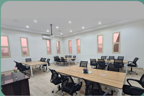
لجنة اليمامة الاجتماعية الأهلية باليمامة (نساء)