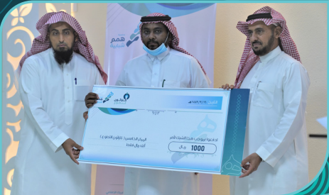
فريق كشافة لجنة الانتمية الاقتصادية بالدلم