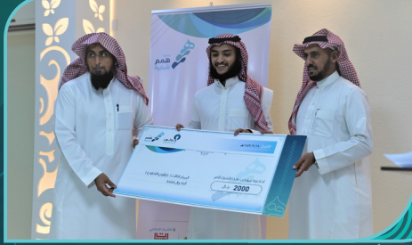
فريق المبتكرون التطوعي