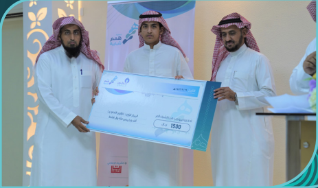
فريق سمو التطوعي