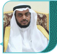
الدكتور خالد بن محمد النقية