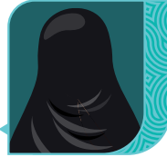
الأستاذة حليمة بنت علي المحسن