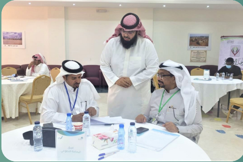
لجنة اليمامة الاجتماعية الأهلية باليمامة (رجال)