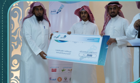
فريق الأرجوان التطوعي